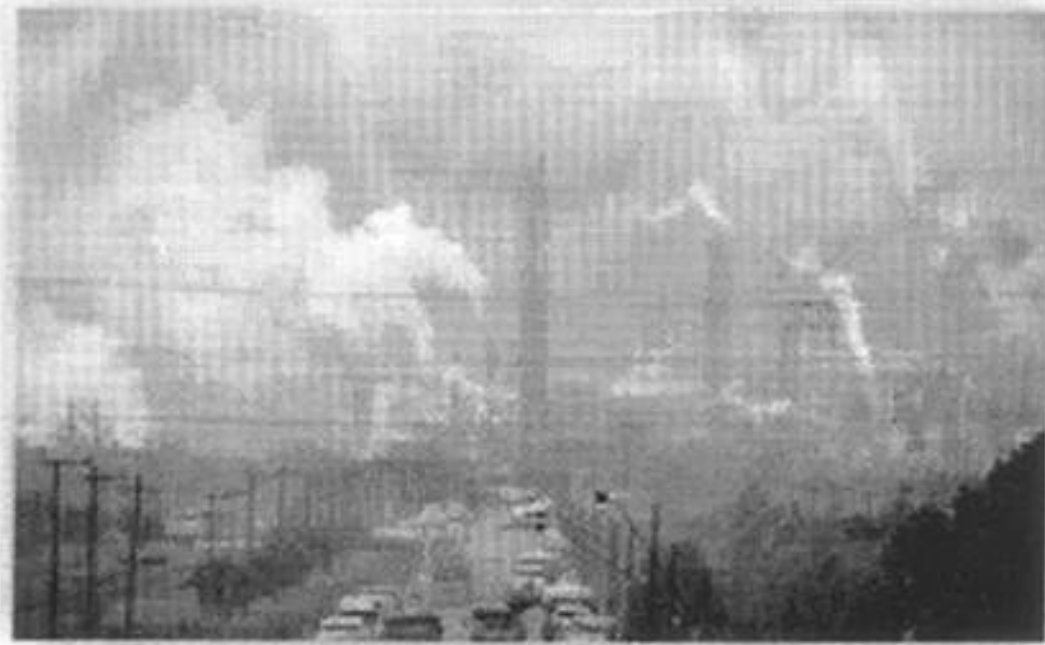
I ENCONTRO DE JOVENS DAS CIDADES IRMÃS

Aqui, vemos uma foto de como era absurda a poluição em Cubatão. Essa poluição causava graves problemas à saúde da população chegando a ser responsabilizada pelo nascimento de crianças alérgicas.