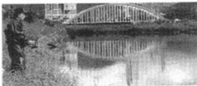
1 ENCONTRO DE JOVENS DAS CIDADES IRMÃS

Tudo esse investimento da pref. mun. de Cub. na busca pela qual. de vida resultou em diversos prêmios entre os quais podemos destacar o Selo Verde da ONU, na ECO 92 como 1, 2, 3. Outra conquista foi a consciência das indústrias em relação ao meio ambiente, com investimentos superiores a 800 mi de dólares. O result. foi o controle de 93% das fontes poluidoras e até o ano 2005 o controle total.