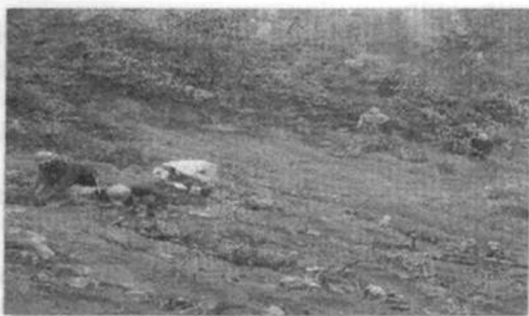
I ENCONTRO DE JOVENS DAS CIDADES IRMÃS

que como vocês podem ver na foto contou com o plantio manual de plantas nativas. Para plantar nas áreas inacessíveis, foi usada a técnica pioneira: a semeadura aérea. Mas para que essa técnica desse certo era preciso que as sementes fossem maiores e pesadas para que caíssem nos lugares certos. As sementes então foram envolvidas em 1 espécie de geléia. Tal processo se revelou eficiente e barato resultando em ótimos resultados.