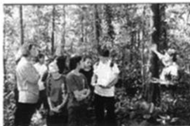
I ENCONTRO DE JOVENS DAS CIDADES IRMÃS

Desenvolvido em parceria com a RPBC, tem como objetivo principal introduzir no jovem o conceito de conservação ambiental objetivando o uso racional dos Recursos Naturais.