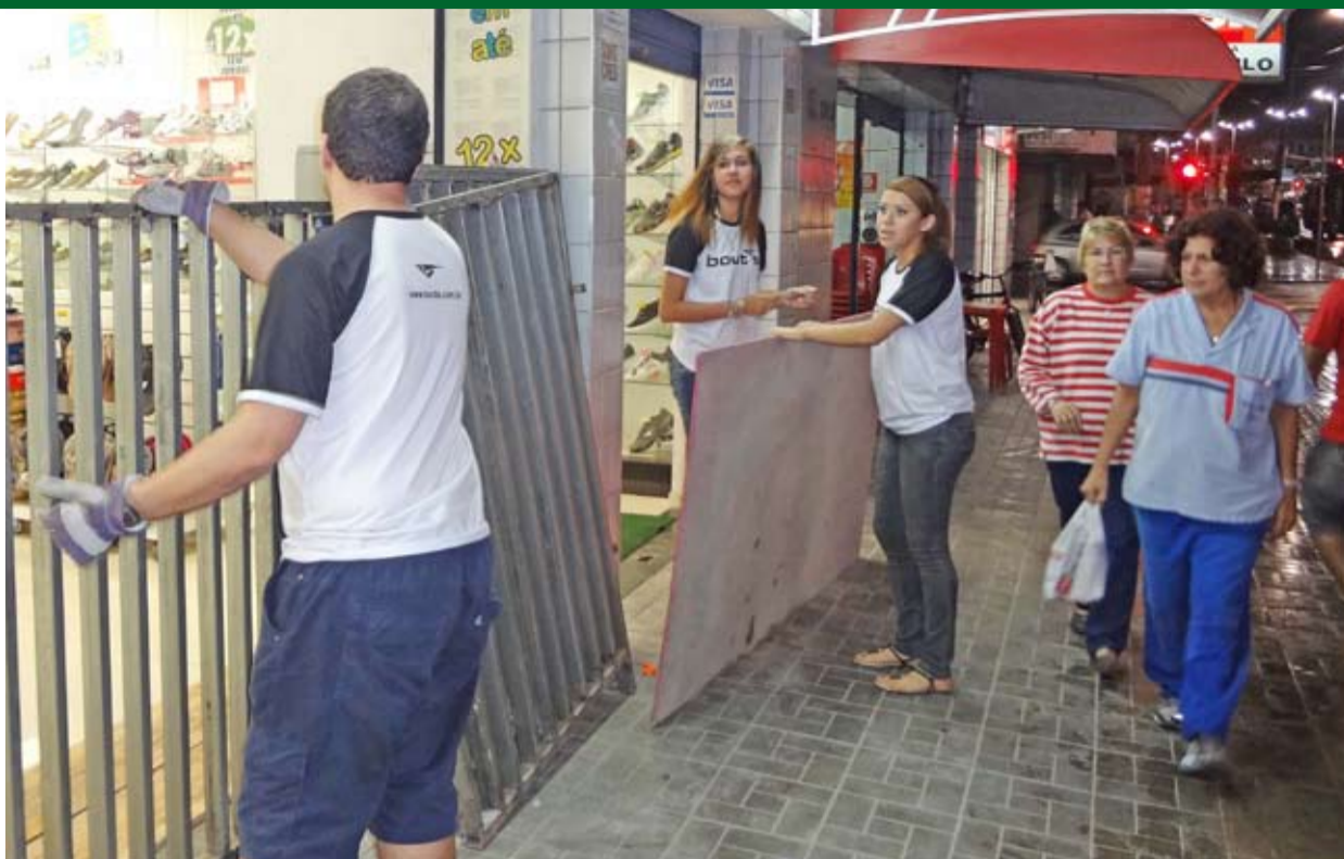
Comerciantes da Nove de Abril reforçam a segurança com grades de ferro.