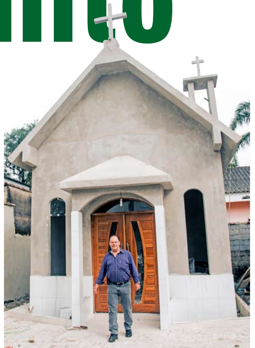
A Capela é uma das inovações do Hotel Lopes