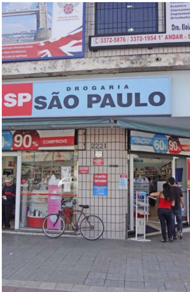
Drogaria São Paulo atenderá à população de Cubatão 24 horas por dia