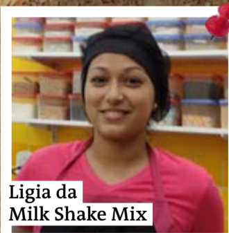
Ligia da Milk Shake Mix