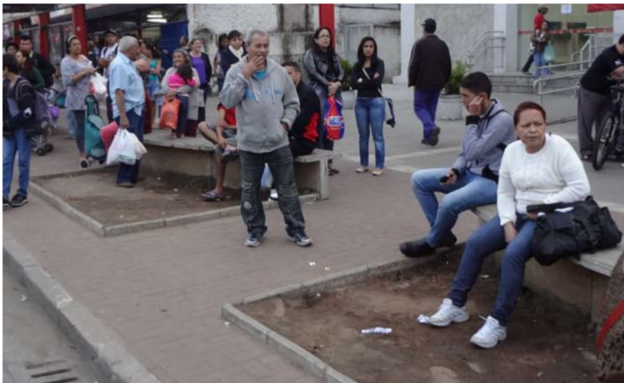
Os jardins sumiram espisoteados pelos passageiros que aguardam os onibus. Culpa das pessoas ou erro de projeto? Quem sabe?