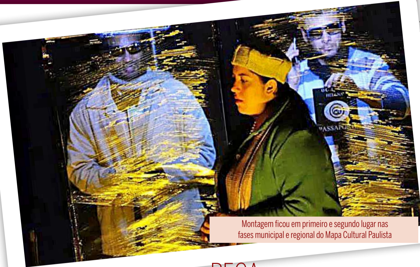
Montagem ficou em primeiro e segundo lugar nas fases municipal e regional do Mapa Cultural Paulista