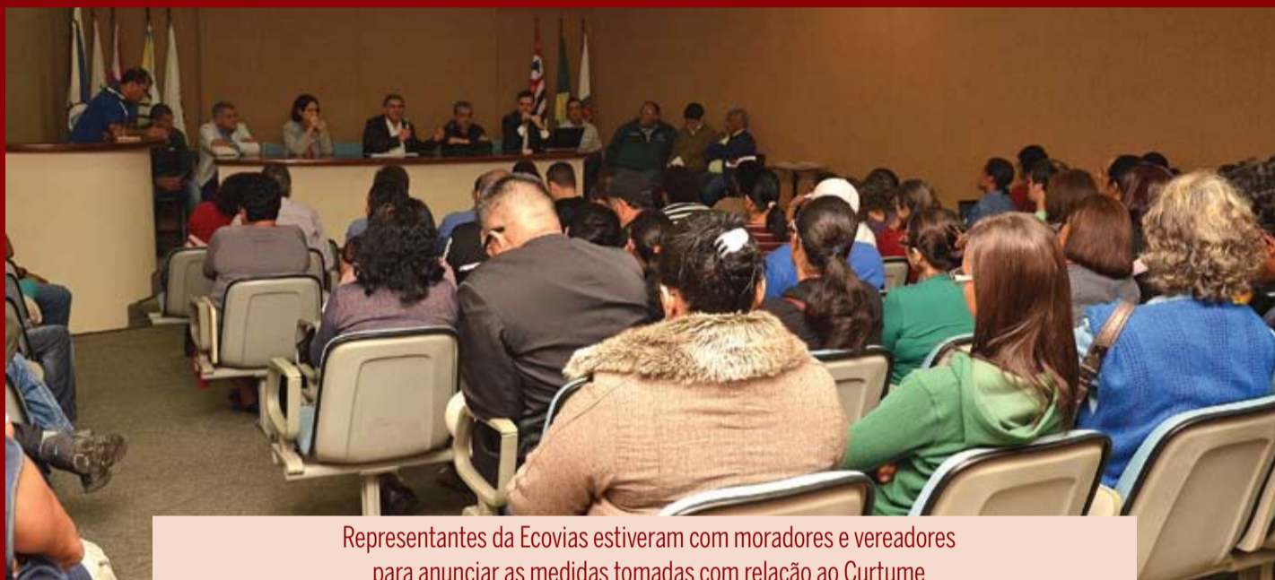
Representantes da Ecovias estiveram com moradores e vereadores para anunciar as medidas tomadas com relação ao Curtume