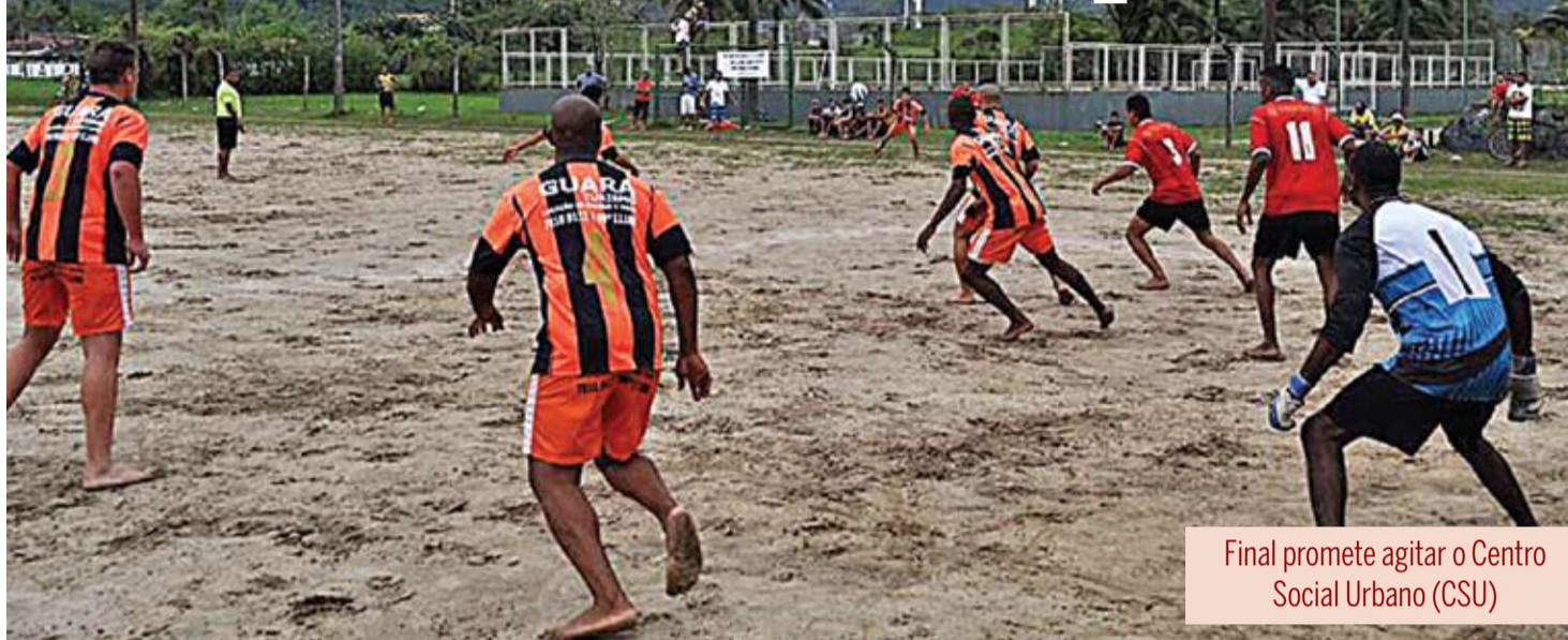
Final promete agitar o Centro Social Urbano (CSU)