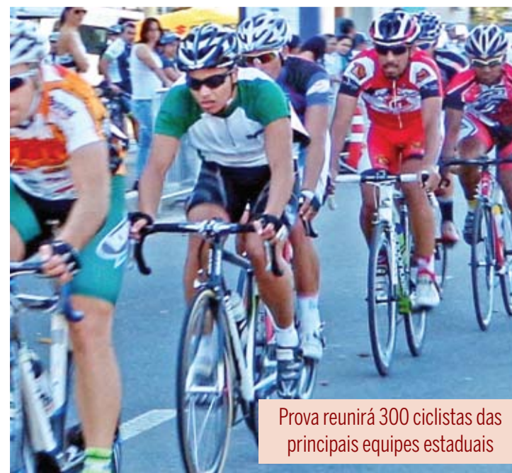
Prova reunirá 300 ciclistas das principais equipes estaduais