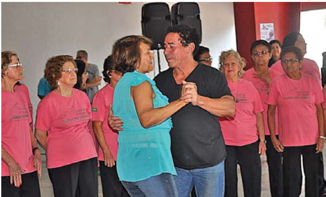
Chá da tarde, baile e apresentações de grupos artísticos da terceira idade ligados a teatro, à coreografia e as manifestações cover. Essas foram algumas das atrações que encerram a Semana Municipal do Idoso, em comemoração ao Dia Internacional do Idoso, celebrado na última terça-feira, 1º.