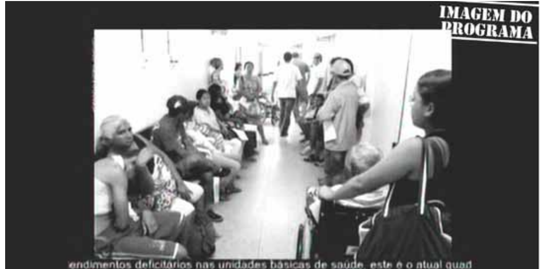
endimentos deficitários nas unidades básicas de saúde, este é o atual quad

O uso das falsas imagens por parte do candidato tuano motivou a Coligação Pra Cubatão Continuar Mudando, da prefeita Marcia Rosa, a entrar na Justiça Eleitoral pedindo o direito de resposta e a suspensão das veiculações.