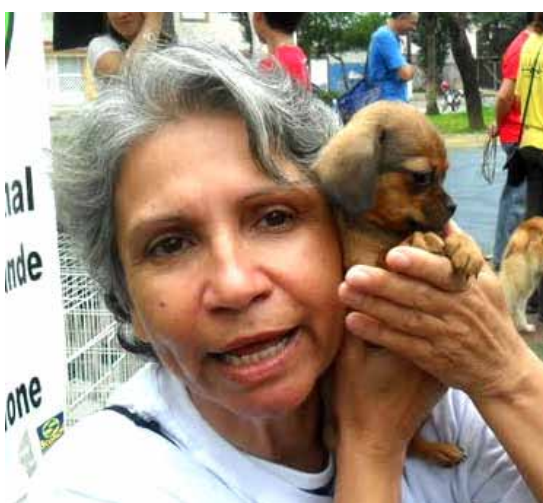
A protetora animal Nativa, que faz aniversário neste sábado (08). Parabéns e muitos anos de vida