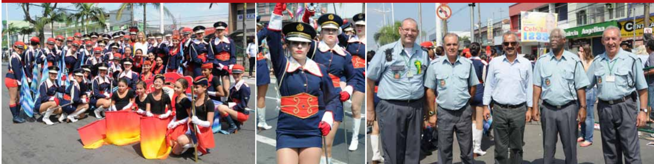
Alguns flashes do Desfile Cívico Militar, no último domingo (02), na Avenida Nove de Abril