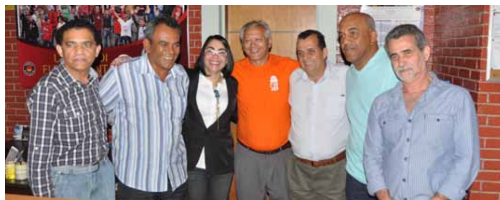
Palestra realizada na noite da última quarta feira (05) no Sindicato da Construção Civil em Cubatão