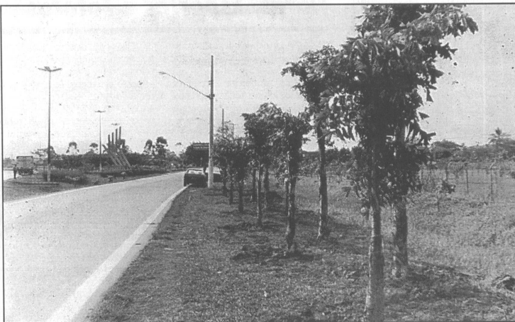
2ª pista da Imigrantes, terá seu ponto de partida, em Cubatão

Os veículos que fazem transportes de cargas para o pólo industrial, são estacionados em locais impróprios, com isso, muitos motoristas são multados, enquanto aguardam a vez para descarregar. Com isso, "os motoristas sofrem assaltos ou, os caminhões ficam parados em frente aos portões das indústrias, provocando congestionamento". Com a construção do Terminal da Vila Parisi, será possível controlar o acesso à região da rodovia, acompanhando todo o trajeto em "on line",