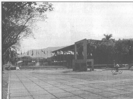
Entregas foram feitas no Bloco Cultural

20 foram doadas para o grupo da terceira idade da Cota 95 e 200; 83 para usuários do serviço de saúde da Prefeitura, cadastrados na Gerência de Assistência Social; 50 para assistidos pela Coordenadoria de Vigilância Sanitária e 100 para pessoas atendidas no Ambulatório de Saúde Mental.