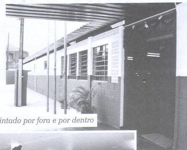
Prédio foi pintado por fora e por dentro

As crianças que estudam na Escola Municipal de Ensino Infantil Mato Grosso foram as grandes beneficiadas com a reforma total daquele estabelecimento de ensino. Antes, elas (e funcionários e professores) até corriam risco de vida por causa de alguns problemas no prédio, como, por exemplo, a corrosão nos forros, causadas por cupins. Com as reformas feitas pela Prefeitura, os forros de madeira foram trocados por outros, de PVC. A rede elétrica, a hidráulica e o piso externo também foram trocados. A obra custou aos cofres públicos R$ 183.817,72