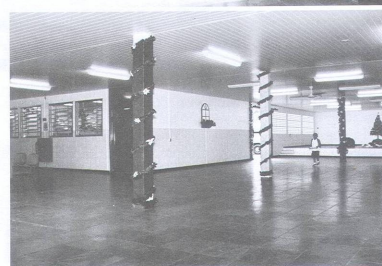
Pátio interno ganhou um novo piso.