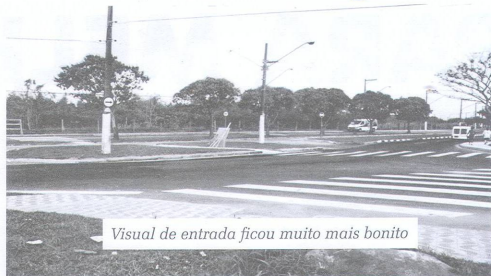
Visual de entrada ficou muito mais bonito

Os novos acessos feitos pela Prefeitura na Vila São José não só tornaram mais bonita a entrada da cidade, como também, facilitaram a entrada e saída do núcleo no sentido da Avenida Tancredo Neves. Antes, os veículos tinham de fazer longas conversões se pretendiam entrar ou sair do bairro. Agora, isso é feito diretamente, com segurança. A obra facilitou a vida não só dos moradores que têm carro, mas, também, dos motoristas de veículos de fornecedores dos estabelecimentos comerciais; das viaturas policiais e de atendimento médico, etc.