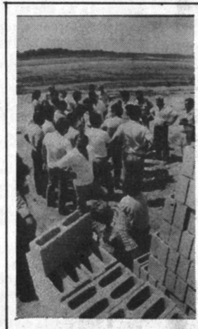
Com o aterro dessa área, mais 646 novas casas serão construídas no Bolsão 8