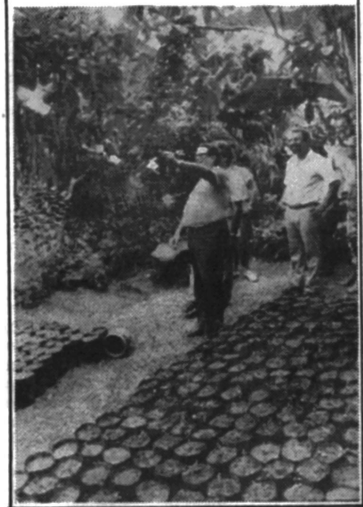
O prefeito com sua equipe visitou a área do Horto Municipal

O Morro do Cotia-Pará é declarado Zona de Preservação Ecológica e, por isso, o prefeito quer transformá-lo em mais um ponto de atração turística de Cubatão. "Queremos que as famílias passem o dia aqui. E vamos criar condições para isso, porque, aqui na cidade, nossas opções de lazer são limitadas. Mas vamos ampliar esse campo com o aproveitamento também da área do Rio Peraquê, atrás da Union Carbide e das margens do Rio Pildes, no antigo Sítio Tuttinga", disse o prefeito Passarelli.