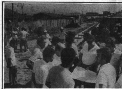
Galerias de águas pluviais na Vila São José fazem parte do projeto de urbanização do bairro.