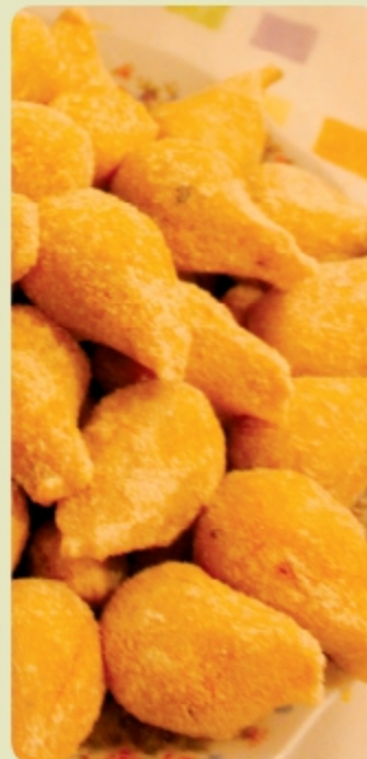
(Receita para 200 unidades)