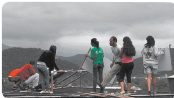
Participantes do grupo PJ Mais durante a instalação do aquecedor solar.

Jovens do programa PJ MAIS, instalam o primeiro aquecedor solar de baixo custo dos bairros Cota na casa de uma das integrantes do projeto.