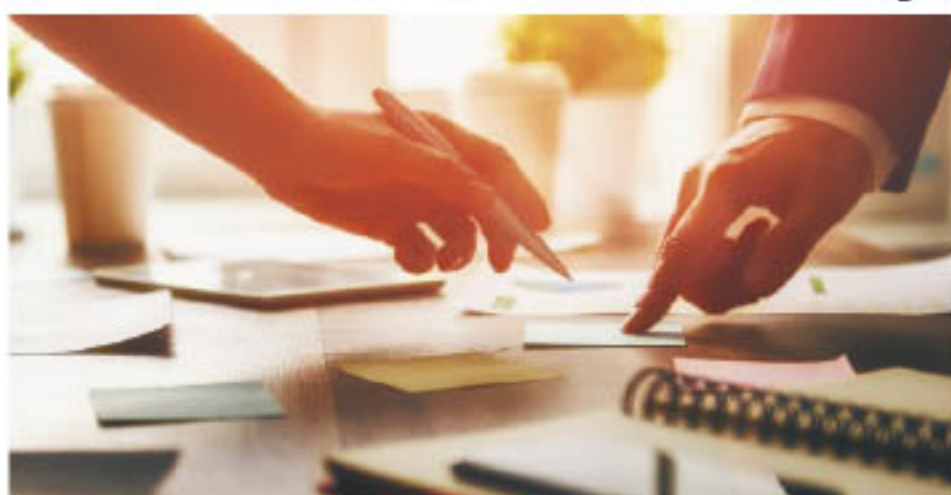
Especialização visa preparar profissionais com expertise técnica e comportamental para o gerenciamento de pessoas

A UNAERP Guarujá está com inscrições abertas para o Curso de Pós-graduação Lato Sensu em Gestão de Pessoas e Liderança. A especialização está prevista para iniciar em abril de 2018, e as inscrições já podem ser feitas pelo site da Unaerp. O conteúdo programático do curso envolve disciplinas como Gestão de Negócios com foco na competitividade; Gestão do Conhecimento e do Capital Intelectual; Comunicação e Relacionamento Interpessoal; Gestão de Projetos; Ética e Sustentabilidade. E ainda, Legislação e Cál-