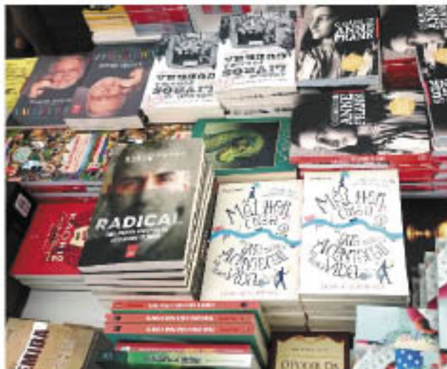
Feira é um dos eventos mais tradicionais do terminal rodoviário de Guarujá