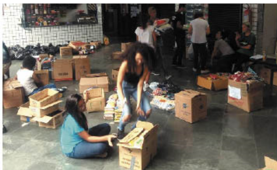
Evento arrecadou mais de cinco mil quilos de alimentos

tores com experiência consolidada em suas áreas de atuação. Com carga horária de 300 horas, as aulas serão semanais às terças e quintas-feiras, das 19h às 23h, com procedimentos interativos que estimulem a reflexão e propiciem a problematização dos conteúdos, além de seminários, estudos de caso, trabalhos e dinâmicas em grupo. Matrículas e informações sobre esse e outros cursos de especialização no Setor de Pós-Graduação da Unaerp Campus Guarujá, pelo telefone (13) 3398-1089 ou no Portal www.unaerp.br .