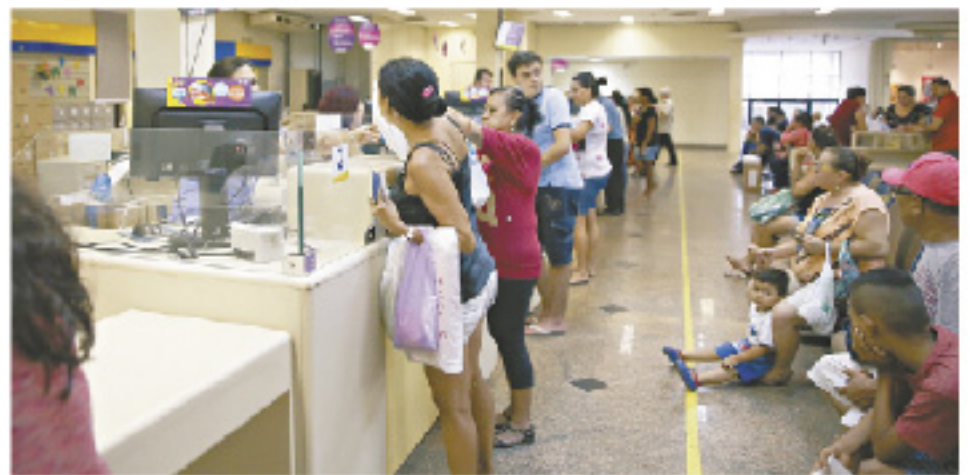
Projeto estipula 20 minutos como tempo máximo em dias normais

Ainda de acordo com a matéria aprovada, as agências terão de manter pessoal suficiente nas seções de atendimento, assim como senhas numéricas, de cada filial, com registros dos horários de entra-