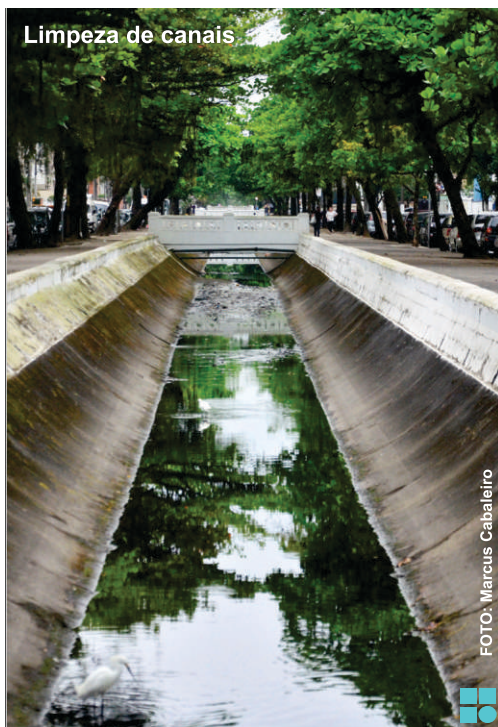
Limpeza de canais