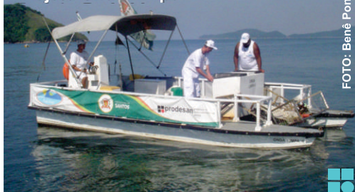
Projeto Onda Limpa