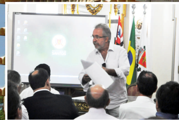
Presidente da PRODESAN S/A faz balanço dos 100 dias da nova gestão.

As atuações mais recentes da Prodesan , você confere neste Boletim Informativo.